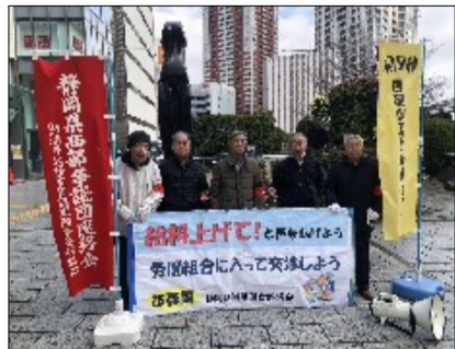
西部地区労連の宣伝

● ユーコープ労働組合 は、28日に第1回団体交渉を行い、組合員45人が参加しました。組合側はすべての雇用区分でのベア水準と年間一時金月数の引き上げや、異別格差の縮小を要求。組合側は4月18日までに前進回答が無ければストライキを決定する旨を表明しています。 ● 地域の行動 では静岡地区労連や西部地区労連が、様々な春闘行動に取り組みんでいます。西部では大企業門前宣伝をホンダ・ヤマハ・JR浜松工場・ホトニクス・スズキ・浜松市役所で行いました。また、宣伝カーを運行し市民へ春闘をアピールしました。静岡地区労連は静岡市や商工会議所への要請行動・宣伝カーでの宣伝を行いました。11日には、伊東地域労連が定期大会に合わせて春闘学習会を行いました。 26国民春闘の後半は、労働組合のたたかいは、労働組合主導の賃上げで、生活改善が実感できる賃上げの実現に向けて、組合員の参加と拡大に全力を上げましょう。