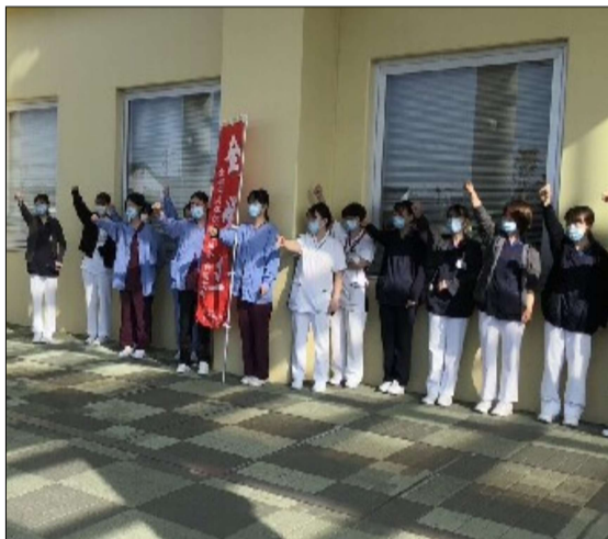
浜松労災病院労組のスト集会

今年の春闘の大きな焦点は物価高騰を上回る賃上げとケア労働者の賃上げの実現です。集中回答日翌日の3月12日を中心に、国民春闘静岡県共闘会議や静岡県評加盟組合は、大幅賃上げ、底上げめざし、ストライキや宣伝などに取り組んでいます。