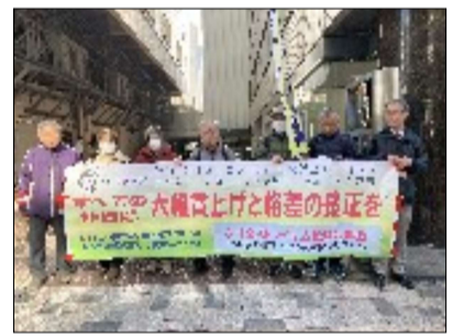
通信労組と支援者のみなさん

● 国労静岡地本 は、2月28日に「ベースアップ獲得貨物総行動」を実施しました。国労東海本部・東海貨物協・名古屋地本・静岡地本並び、地域共闘の仲間など、総勢25名が結集しました。静岡駅北口地下道で、26春闘の情勢・全ての労働者の賃上げ・JRの安全安定輸送の確立を訴えました。貨物会社では、多くの職場で要員不足が解消されず、劣悪な労働条件は改善されないままとなっており、要求通り満額回答で応え、将来に向けやりがいを持ち、健康で安心して働き続けられる労働環境を整えることを貨物会社に訴えました。