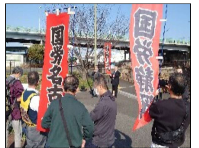
国労と支援者のみなさん

● 生協関連一般労働組合 は、26日静岡市内の配送センターで、月額1万円以上の賃上げへ会社回答の上積み求めてストライキを決定しました。ストライキには23人が参加し、組合員は「物価高騰で、子どもを育てるのも大変だ」「仲間がどんどん退職していくそれをとめるためにも最低1万円の賃上げは必要だ」など声を上げました。県評傘下の組合から9人が支援に駆けつけました。