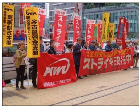
郵政産業ユニオンのスト集会

● 国労静岡地本 は、2月28日に「ベースアップ獲得貨物総行動」を実施しました。国労東海本部・東海貨物協・名古屋地本・静岡地本並び、地域共闘の仲間など、総勢25名が結集しました。静岡駅北口地下道で、26春闘の情勢・全ての労働者の賃上げ・JRの安全安定輸送の確立を訴えました。貨物会社では、多くの職場で要員不足が解消されず、劣悪な労働条件は改善されないままとなっており、要求通り満額回答で応え、将来に向けやりがいを持ち、健康で安心して働き続けられる労働環境を整えることを貨物会社に訴えました。