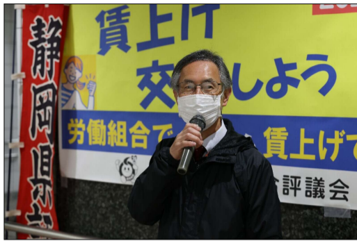
駅地下道での訴え

〒420-0851 静岡市葵区黒金町55番地 交通ビル3階 TEL 054-287-1293 FAX 054-286-7973 Eメール kenpyo@cy.tnc.ne.jp