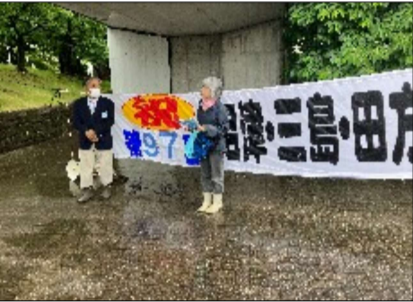
沼津・三島田方会場