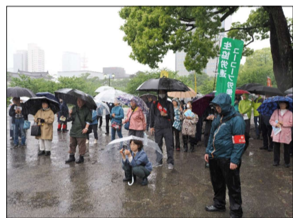
雨の静岡中央メーデーの様子