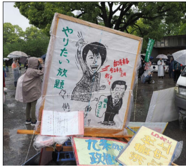
高市批判のプラカード（静岡）