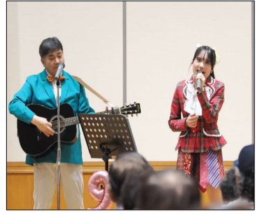
トイイツ戦線のお二人

静岡県憲法会議が主催する「憲法を考える市民の集い」が5月3日の憲法記念日に開催されました。参加者は280人でした。 第1部は政治系歌謡ユニットのトイイツ戦線のステージ「爆買！トマホーク」というオリジナル曲や「戦争を知らない子どもたち」など4曲を披露しました。最後はコール&レスポンスで盛り上がりました。