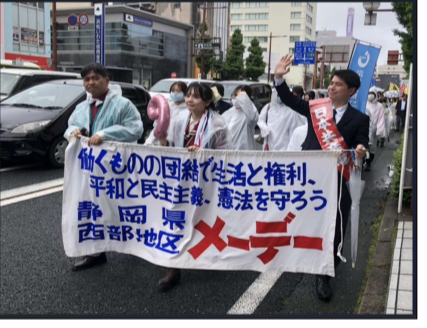
西部地区のパレード行進