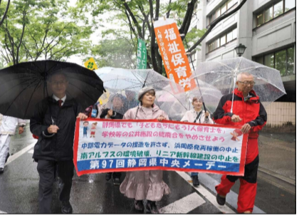
静岡のパレード行進